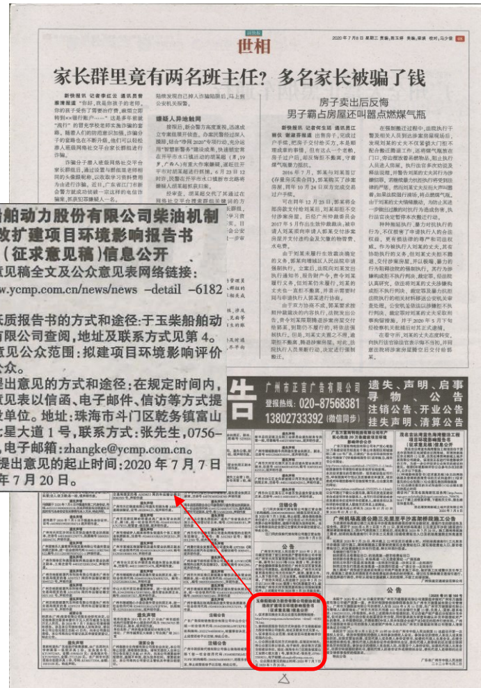
图 3-2 征求意见稿公示报纸公示照片 (第 1 次)