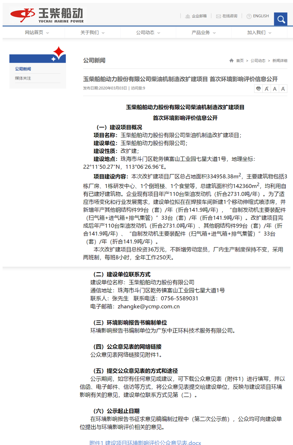
图 2-1 首次环境影响评价信息网络公示截图