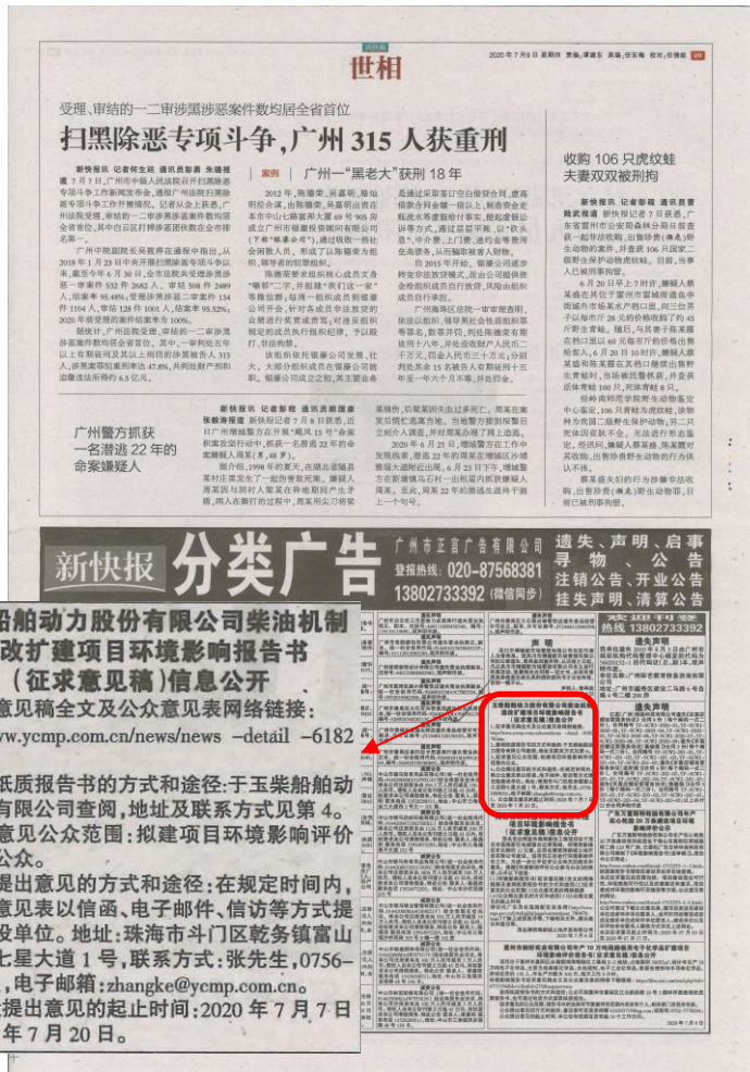
图 3-3 征求意见稿公示报纸公示照片 (第 2 次)