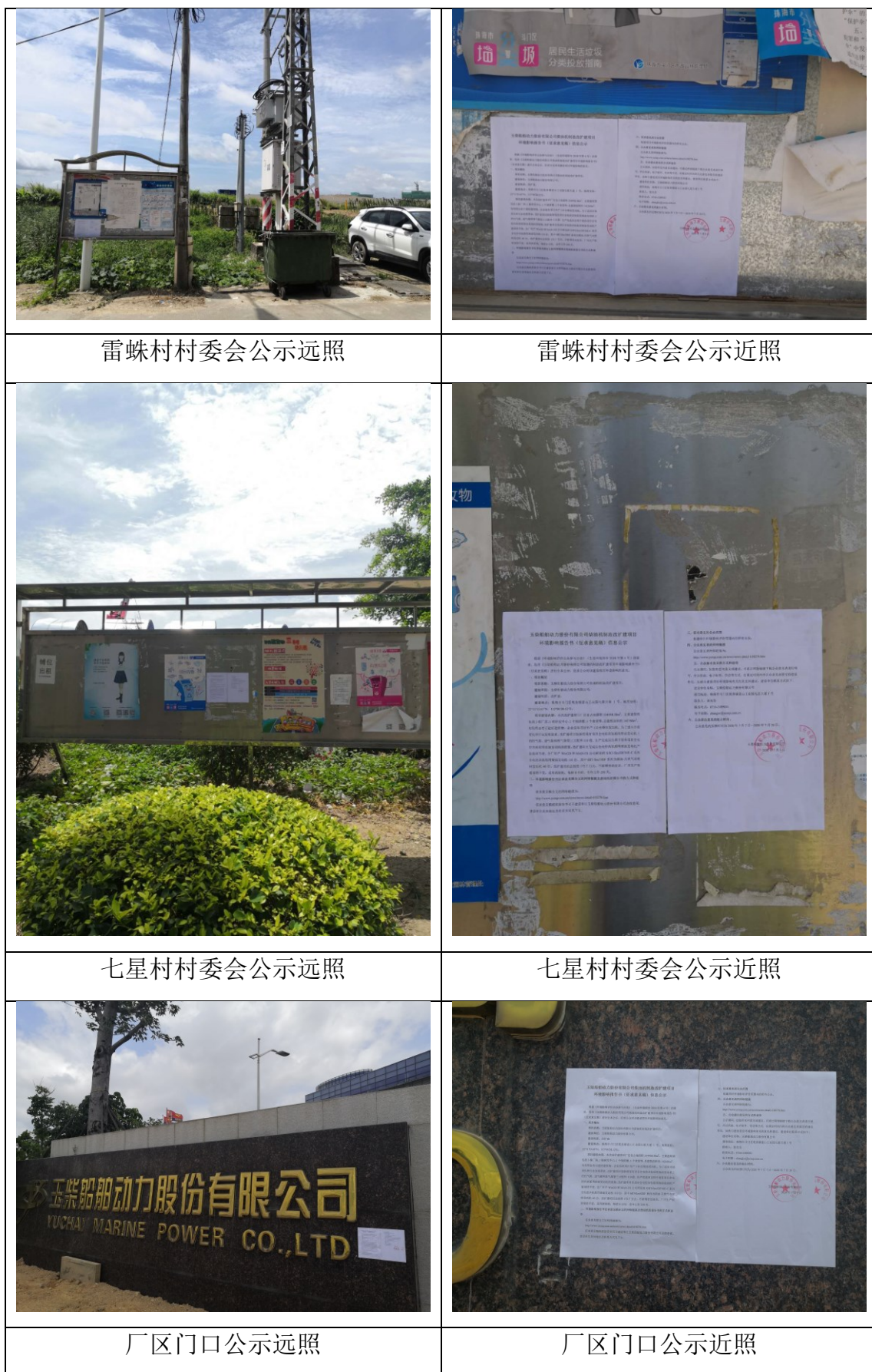
图 3-4 公众参与征求意见稿公开现场公示照片